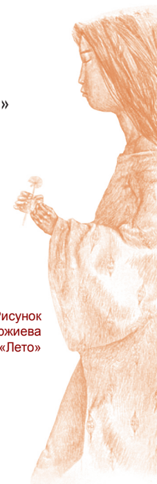
Рисунок Зорикто Доржиева «Лето»

Как преодолеть экзаменационную тревожность